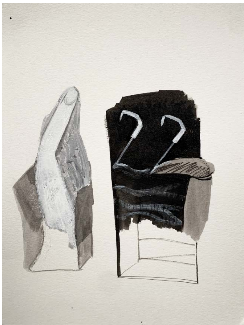
SOFIA QUIRNO Catch 22, 2019 Acrílico y tinta sobre papel | Acrylic and ink on paper 30 x 23 cm | 11.8 x 9 in