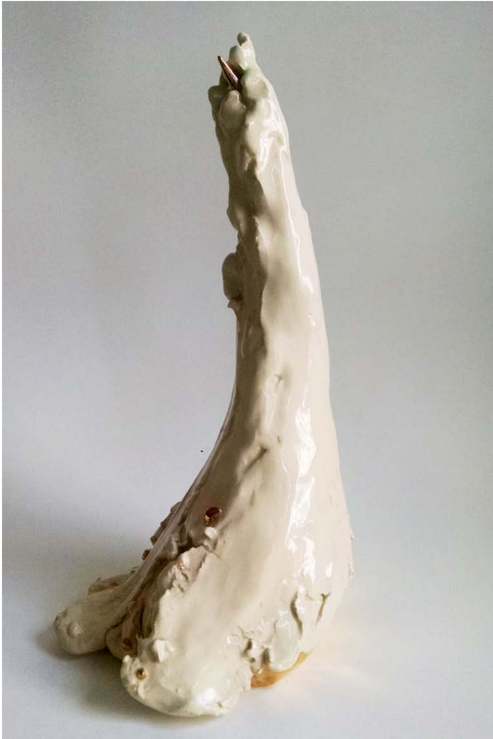
IVANA BRENNER Sin título (Uña), 2019 Gres y lustre de oro | Gres and gold luster 38 x 22 x 18 cm | 14.9 x 8.6 x 7 in