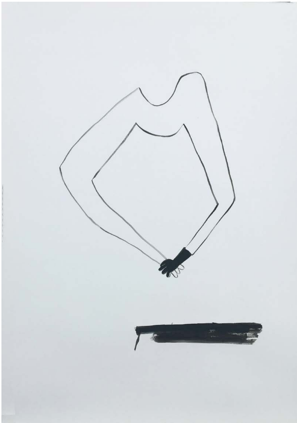
SOFIA QUIRNO Ahora que, 2019 Acrílico y óleo sobre papel | Acrylic and oil on paper 112 x 76 cm | 44.1 x 30 in