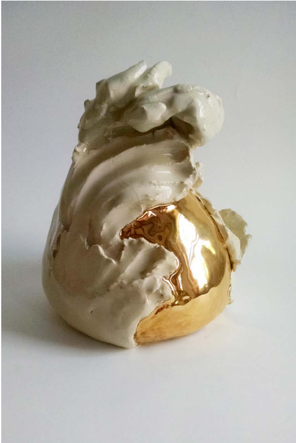
IVANA BRENNER Sin título (Huevo Poché), 2019 Gres y lustre de oro | Gres and gold luster 25 x ø 21 cm | 9.8 x ø 8.2 in