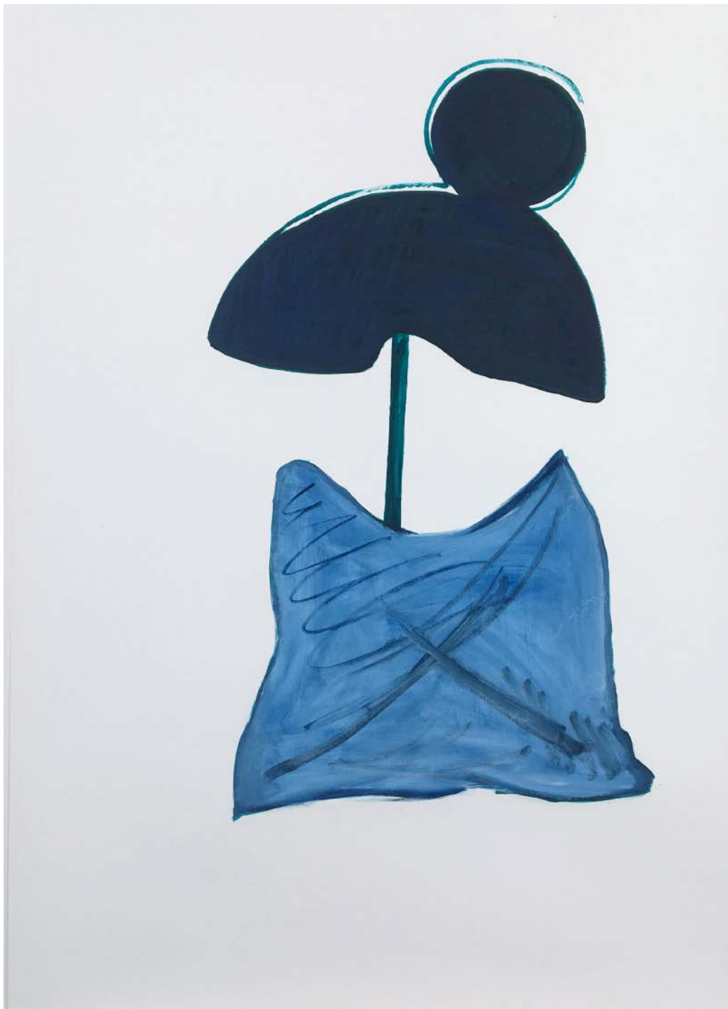
SOFIA QUIRNO Hay días de nieve, 2019 Acrílico y óleo sobre papel | Acrylic and oil on paper 112 x 76 cm | 44.1 x 30 in