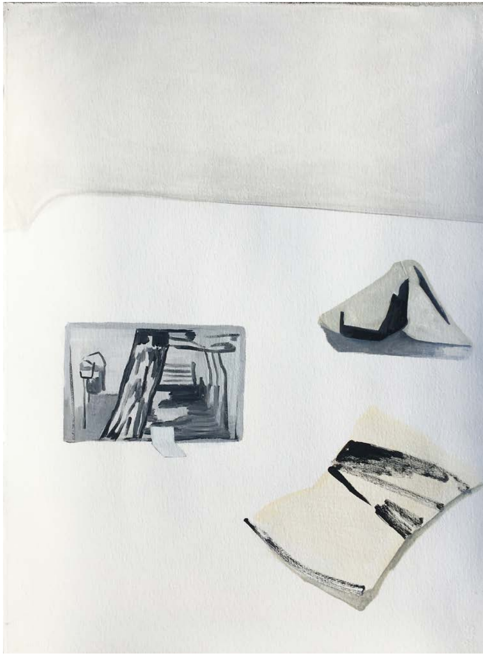
SOFIA QUIRNO Paisaje, 2019 Acrílico y óleo sobre papel | Acrylic and oil on paper 76,5 x 56 cm | 30.1 x 22 in