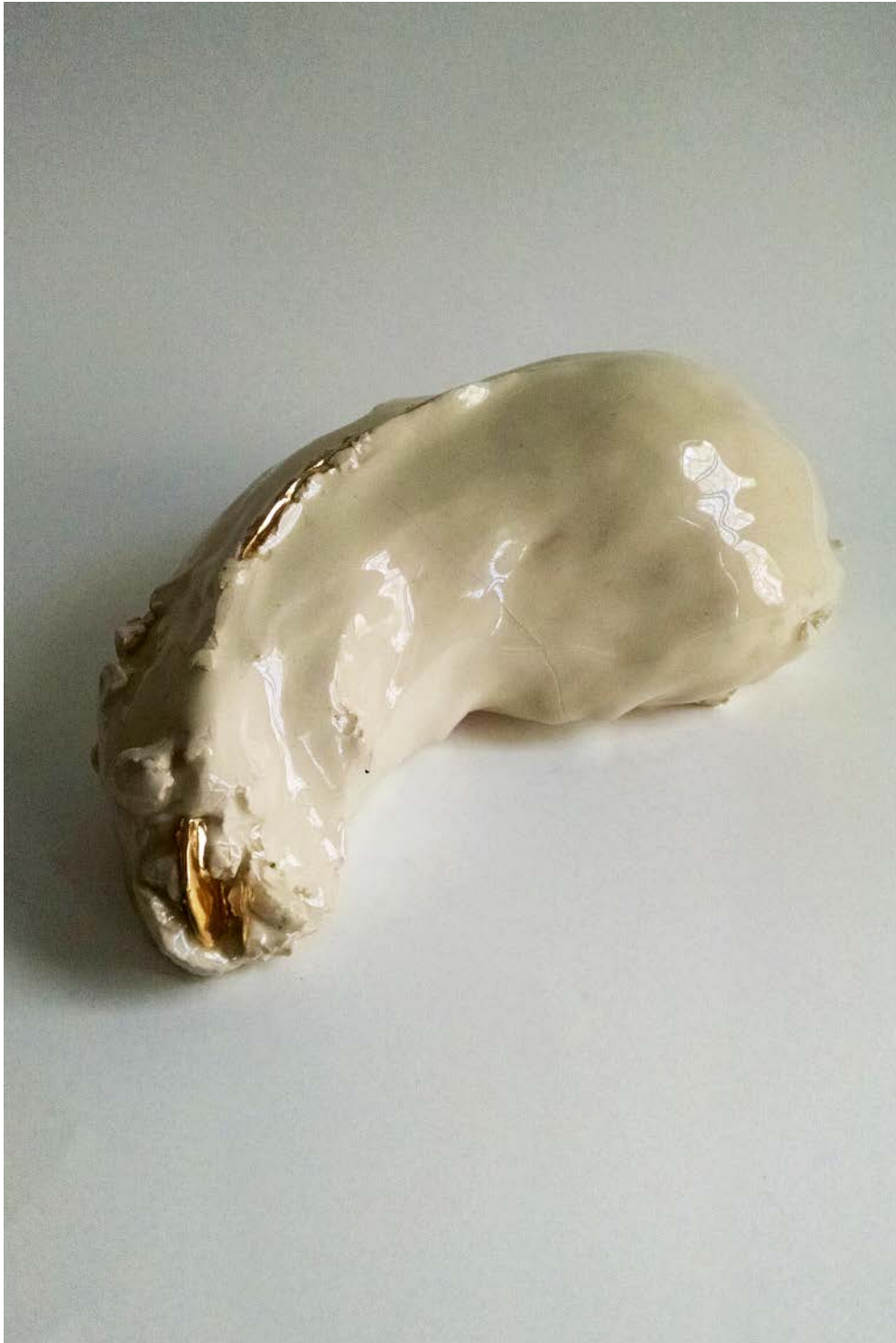
IVANA BRENNER Sin título (Sin título), 2019 Gres y lustre de oro | Gres and gold luster 38 x 22 x 18 cm | 14.9 x 8.6 x 7 in